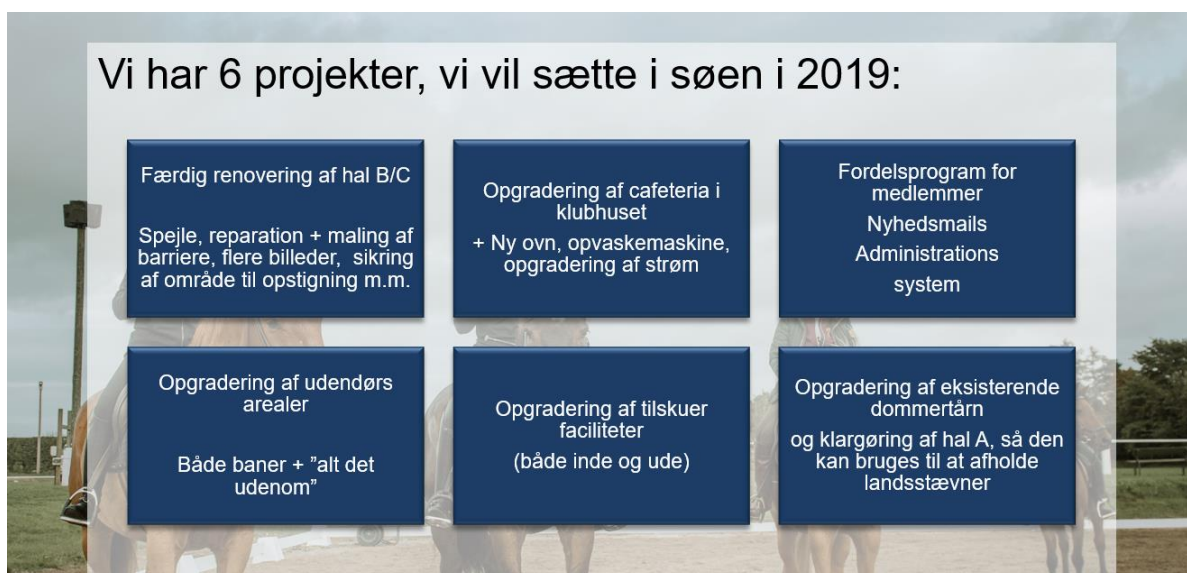
Illustration fra formandsberetningen med de 6 projekter bestyrelsen ønsker at sætte i søen